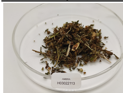
Foto del campione

Grado di umidità al momento dell'analisi - 14.60%